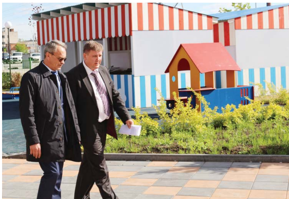
Читайте на стр. 2

В Кутузовском поселении уже в июле заработает единственный на сегодня муниципальный детский сад