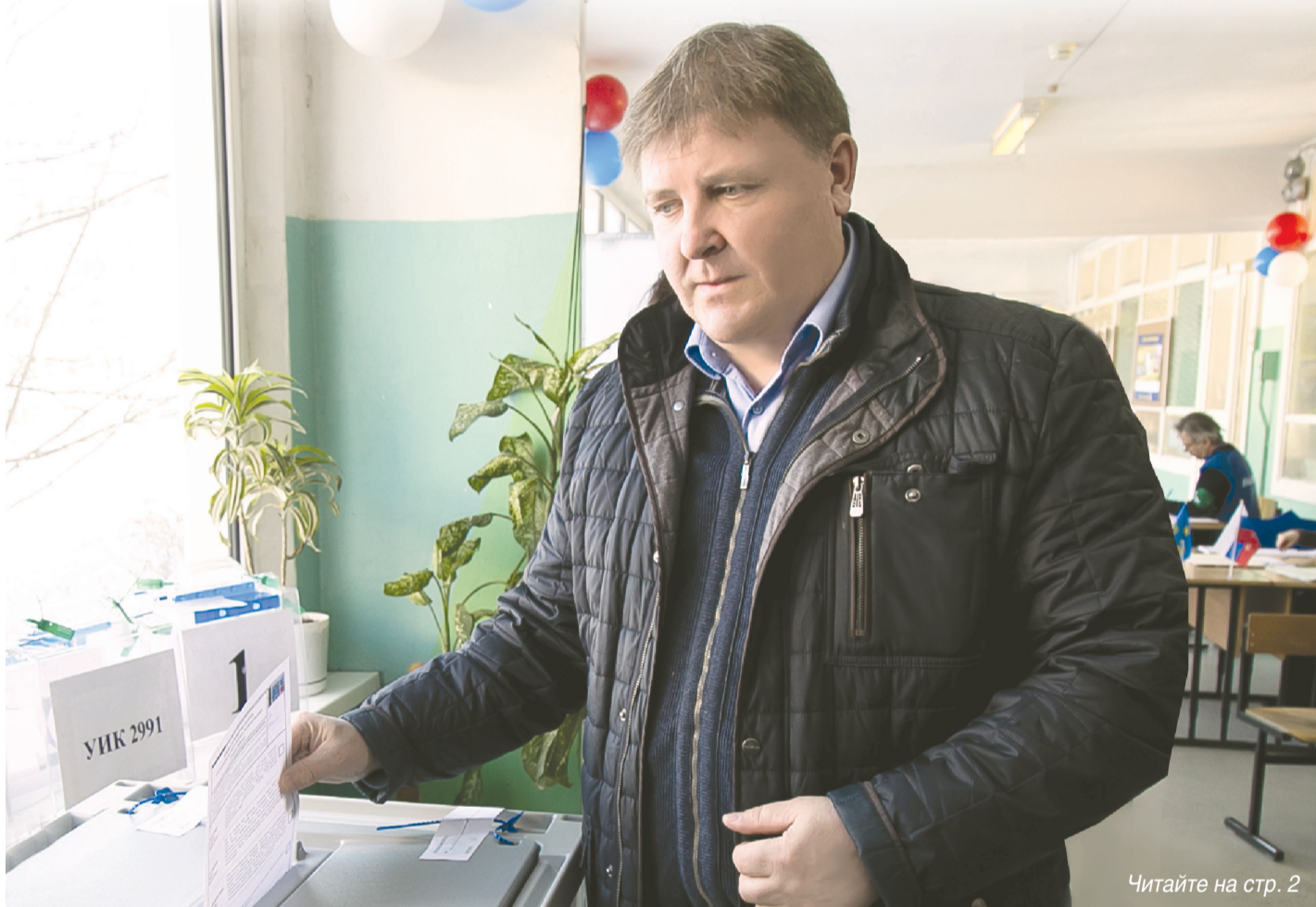
Читайте на стр. 2

В Солнечногорском районе за В.Путина проголосовали 74,89% избирателей