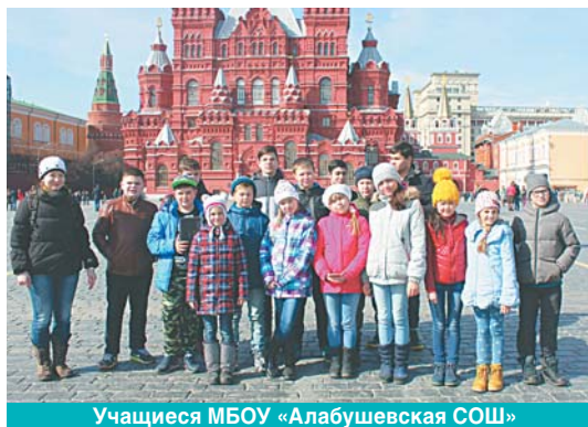
Учащиеся МБОУ «Алабушевская СОШ»