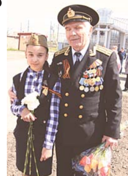
В Алабушево воспитывают патриотов

Школьный клуб – одна из форм организации досуга учащихся. Та-