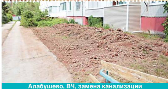
Алабушево, ВЧ, замена канализации

В деревне Голубое по улице Родниковой проводятся работы по замене трубопроводов и запорной арматуры в тепловых камерах. У дома 4 монтажные работы завершены. В камерах у домов 1, 3, 5 проведен демонтаж трубопроводов обвязки и задвижек, начались монтажные работы у дома 3.