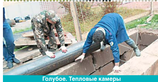
Голубое. Тепловые камеры

По завершении монтажных работ будет проведена опрессовка сетей и запорной арматуры, выполнена теплоизоляция труб, проведены работы по восстановлению асфальта и нарушенного газона. Срок пуска горячей воды не меняется – с 28 июня.