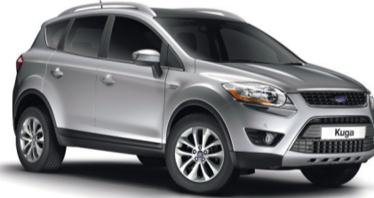
FORD KUGA от 1 012 000 руб