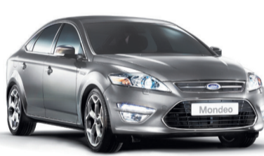
FORD MONDEO от 727 500 руб