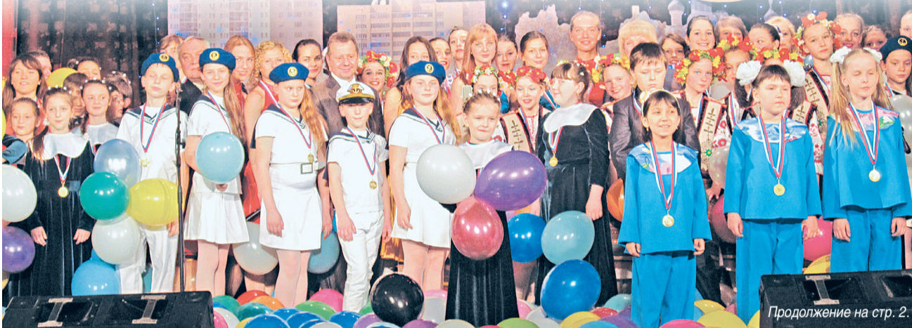
Гала-концерт лауреатов международных, всероссийских и областных творческих конкурсов «Таланты Солнечногорья» прошел 17 апреля в ГЦНТИД «Лепсе» в седьмой раз.