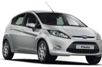
FORD FIESTA от 590 000 руб