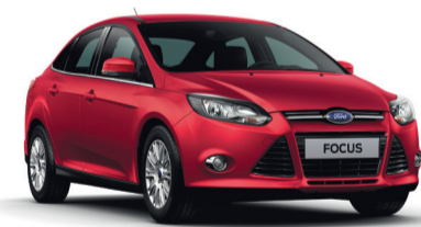
FORD FOCUS от 532 000 руб

Предъявите этот купон в салоне РОЛЬФ ХИМКИ и получите комплект зимней резины в ПОДАРОК*.