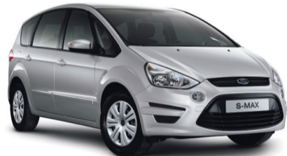
FORD S-MAX от 1 022 000 руб