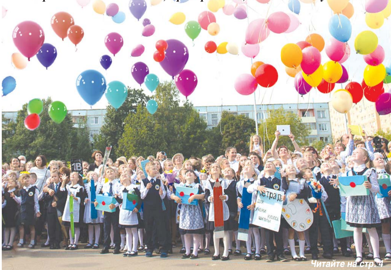
Читайте на стр. 4

1600 первоклассников пришли в школы Солнечногорья 1 сентября. А всего к занятиям приступили около 14 тыс. юных солнечногорцев. В школах района 1 сентября состоялись торжественные линейки. Мальчишек и девочек на пути в будущее напутствовали представители власти, предприятий, а также выпускники