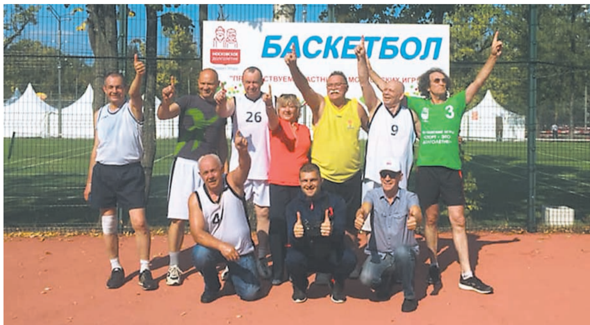
На фестивале «Спорт – это долголетие» команды ветеранов из Зеленограда заняли первые ступени пьедестала в баскетболе и волейболе.

Цель этого проекта, стартовавшего 1 марта прошлого года, – обеспечить москвичам старшего поколения новое качество жизни. Пенсионеры получают возможность вести активный образ жизни, общаться, реализовать себя в творчестве и хобби. В городе открыто более 8000 кружков, где уже 190 тысяч пенсионеров занимаются спортом, танцами, изучением языков, уроками компьютерной грамотности, художественным, музыкальным и прикладным творчеством. Планируется, что в дальнейшем проект станет одним из инструментов реабилитации и профилактики заболеваний у пожилых людей.