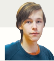
САША КУЗЬМИН, БЛОГЕР