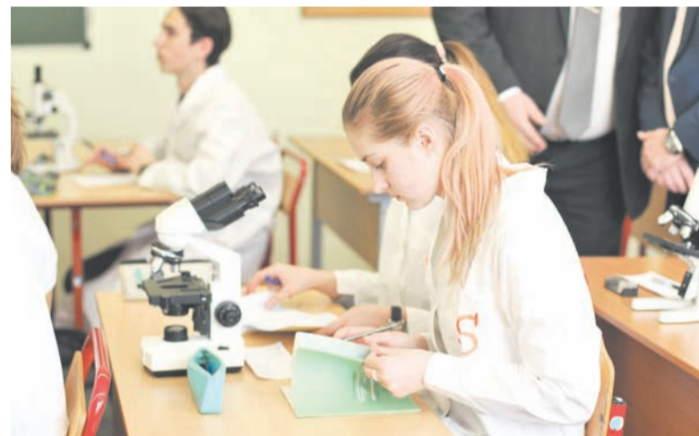
Стартовой площадкой проекта «Московская электронная школа» стал Зеленоград.

30 с лишним тысяч сценариев уроков, 35 тысяч интерактивных образовательных приложений, более тысячи электронных учебных пособий и учебников, свыше 435 тысяч отдельных учебных материалов, к которым регулярно обращаются 430 тысяч учителей и школьников. Педагогам, активно использующим ресурсы МЭШ, положена надбавка к заработной плате. За создание учебного цифрового контента свыше 370 московских педагогов поощрены грантами.