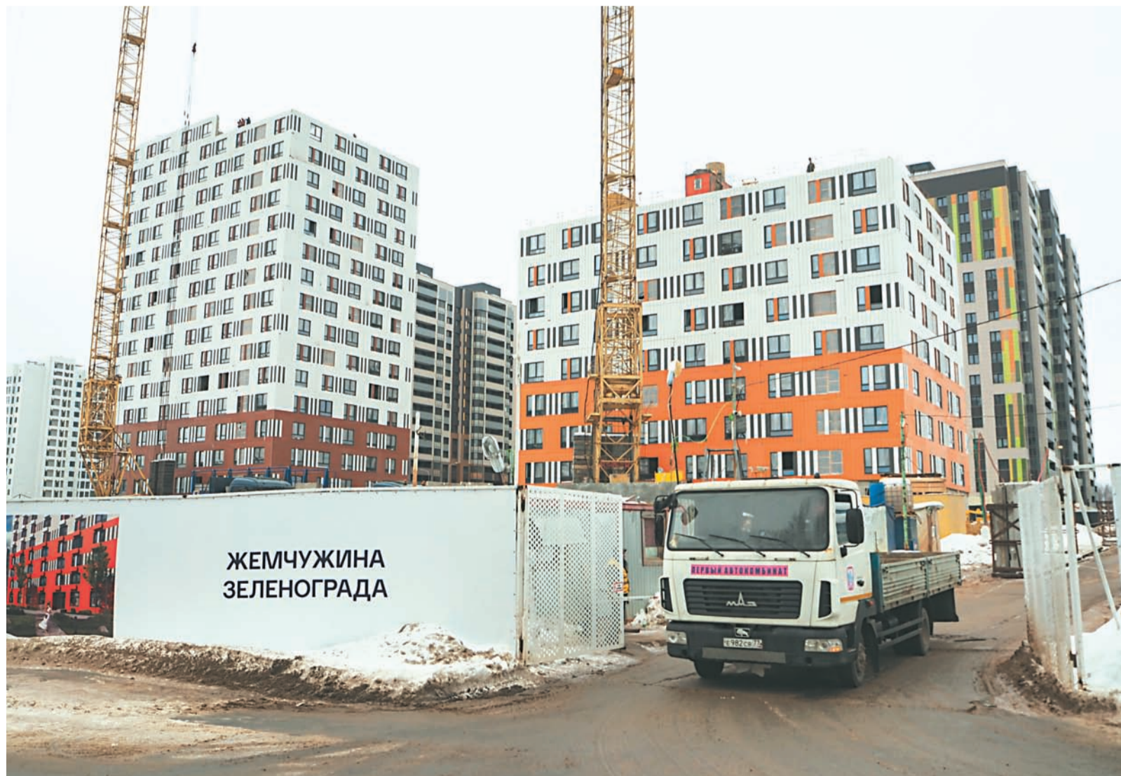
Строительство 17 микрорайона.

На нынешний год строительный задел в округе приличный. Так, в районе Крюково будут введены в эксплуатацию два детских сада – в 16 мкрн на 200 мест и 17 мкрн на 220 мест. 17 мкрн активно строится, причем наряду