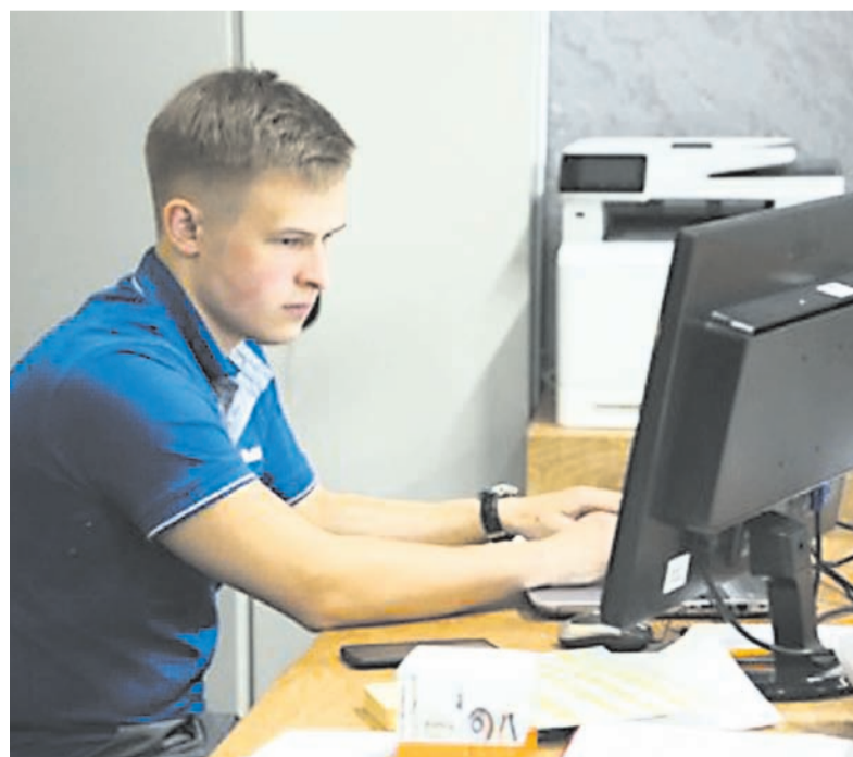
За три года работы сервиса «Мои достижения» пройдено около 300 тыс. диагностик.