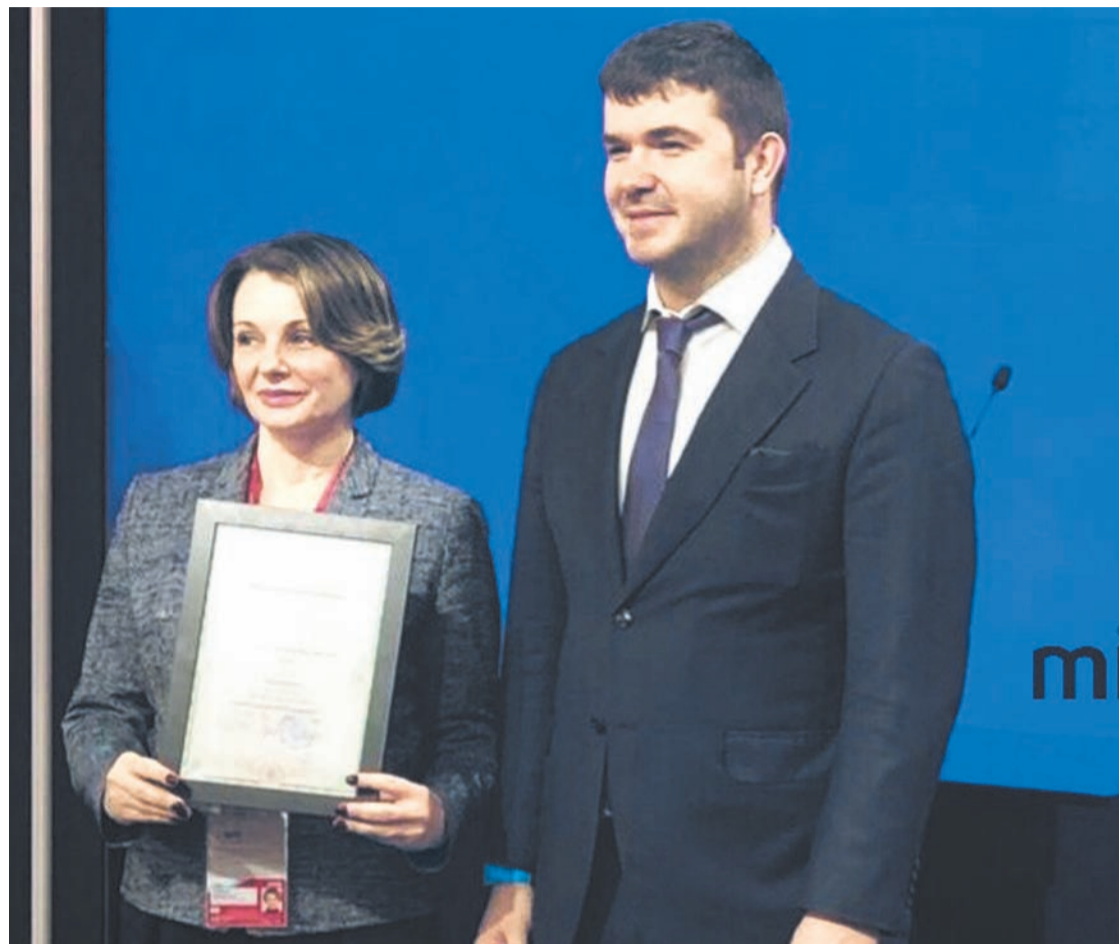
Статус резидента ОЭЗ дает возможность применения льготных налогового и таможенного режимов.

Резидентами ОЭЗ являются 50 высокотехнологичных производств, для которых законодательством предусмотрены льготные налоговый и таможенный режимы для ведения технико-внедренческой деятельности.