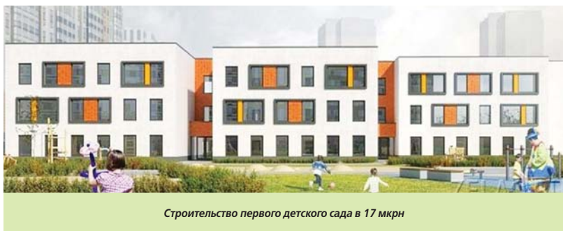
Строительство первого детского сада в 17 мкрн

– Адресной инвестиционной программой города Москвы