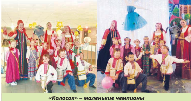
«Колосок» – маленькие чемпионы

С 1 декабря 2017 г. по 26 марта 2018 г. в ДТМ «Хорошево» проходил фестиваль «Один день с театром». В рамках заочного тура приняло участие 5724 человека. Соревнования проводились в 3-х возрастных группах. Программа первого тура фестиваля включала номинации «Драматический театр», «Музыкальный театр», «Театры разных жанров», «Литературный театр», «Театр для самых маленьких», «Театральная планета». Второй этап начался в марте.