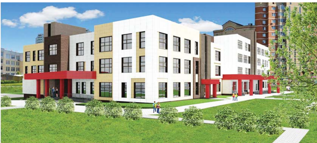
Учебный корпус на 550 мест с дошкольным отделением на 250 мест в 20 микрорайоне

МКАД в районе пересечений. К знаковым объектам можно отнести и реконструкцию Калужского шоссе: на уже завершённых участках магистраль превратилась в современную, безопасную скоростную дорогу. Если говорить об объектах улично-дорожной сети, метрополитена, то здесь сложно выделить какие-то знаковые, этапные объекты. С каждой новой станцией метро, с каждым новым участком дороги, новой многоуровневой развязкой город становится ближе к горожанам, более безопасным, более комфортным, более доступным.