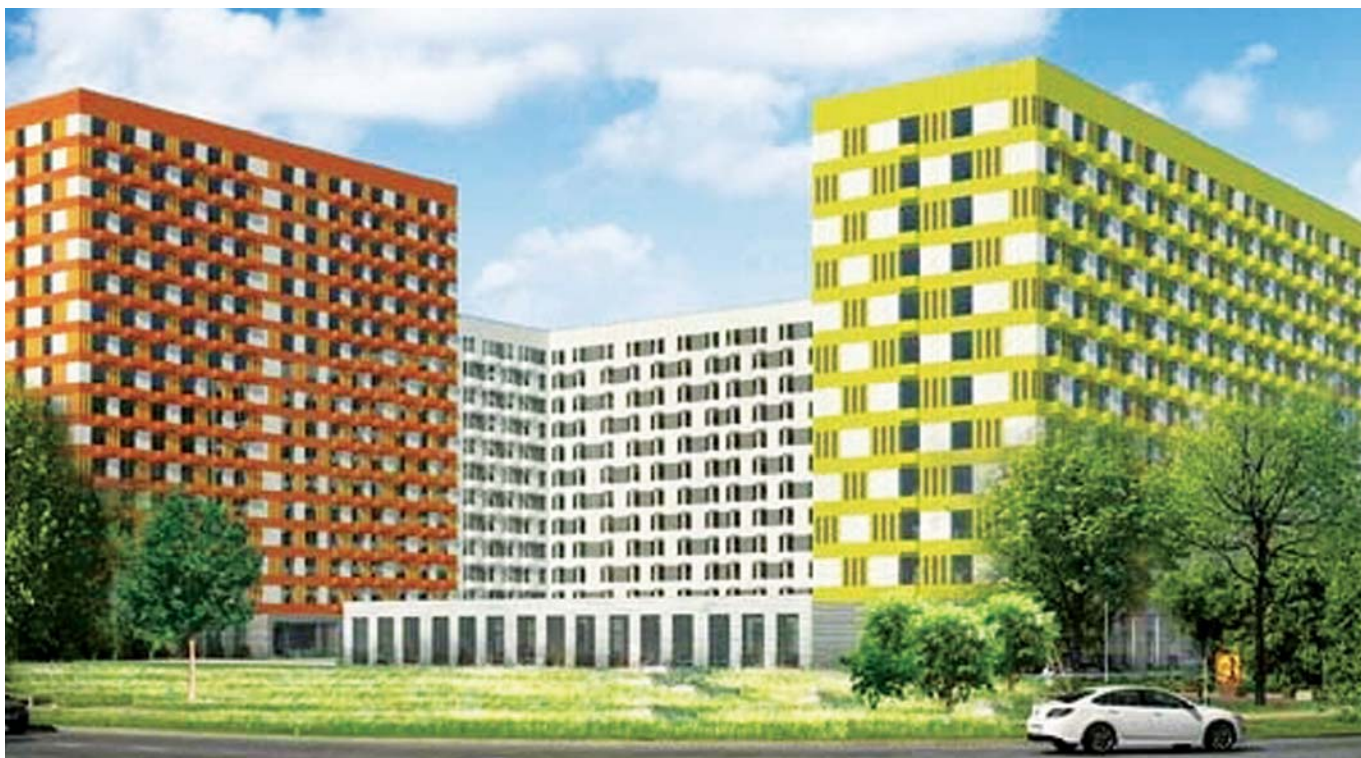
Жилые дома позиция 11 корпус 1, корпус 2 в 17 микрорайоне Зеленограда