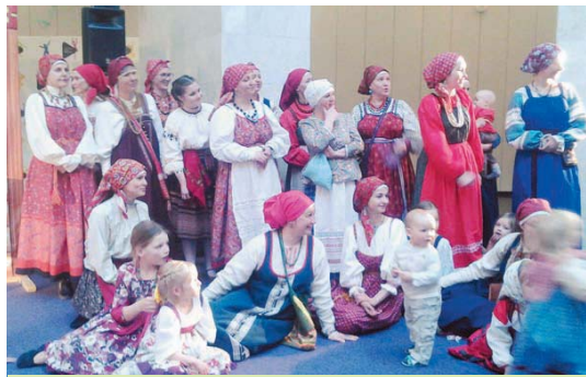
Задача «Дикого поля» – сохранение традиций

– Очень сильно. Это отражено в песнях: девушка оплакивает свое прощание с подругами – ведь после свадьбы она будет в другом статусе и должна теперь общаться уже с замужними женщинами. Замужняя женщина уже не заплетает