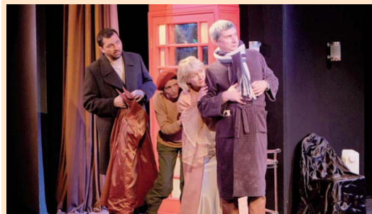
Сцены из спектакля

Всего за три года мир героев перевернулся, и мы с увлечением следим, как меняются