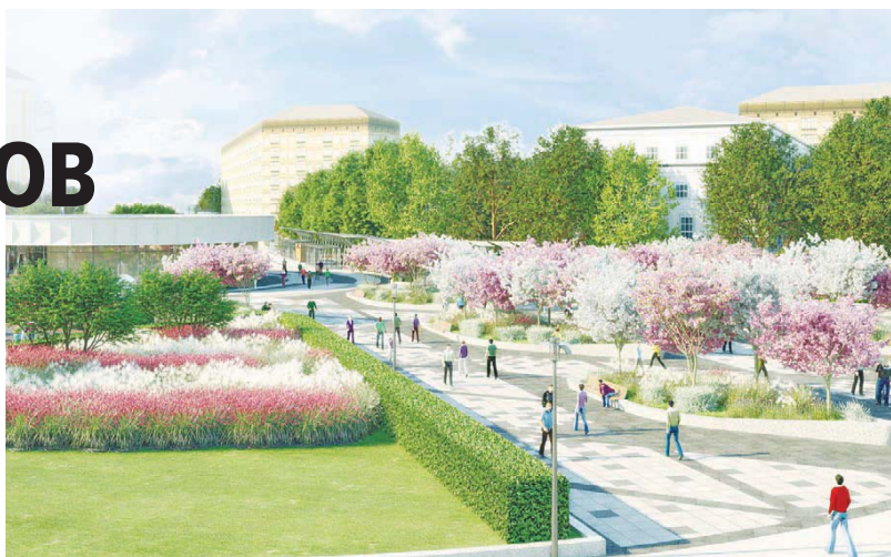
1905 года (площадь у метро)

Всю зиму в городе проходили общественные обсуждения и встречи с жителями, на которых москвичи могли внести правки в предложенные проекты. Например, по желанию горожан в парке Дружбы отремонтируют площадку у памятника воинам Афганистана, но откажутся от создания площадки для запуска дронов, в парке 850-летия Москвы сделают больше площадок для выгула собак, а в парке Святослава Федорова построят горку для зимних забав.