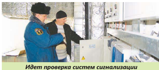
Идет проверка систем сигнализации

– Должна прозвучать короткая инструкция для людей, что им делать: где выход, куда идти, – дополнил сотрудник прокуратуры.