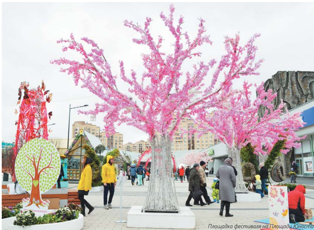
Площадка фестиваля на Площади Юности

№14 (560) | Пятница, 13 апреля 2018 года