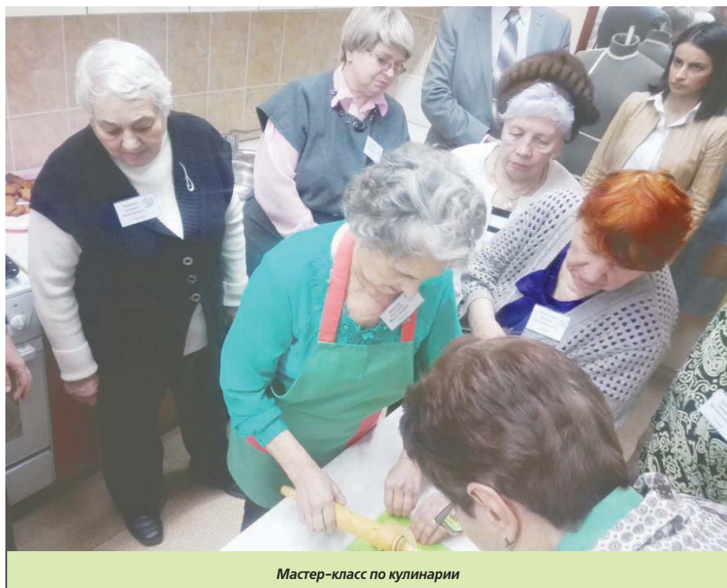
Мастер-класс по кулинарии

«Московское долголетие» – первый подобный проект в России. Впервые общественность и городские власти задумались о том, что людям старшего поколения мало получать пенсию и льготы: они хотят жить полноценной жизнью, общаться,