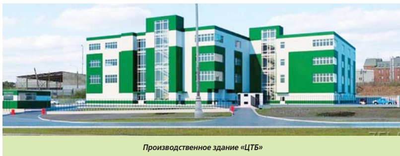
Производственное здание «ЦТБ»

Это и МЦК, кольцевая железнодорожная магистраль, которая была реконструирована и интегрирована в городскую систему пассажирских перевозок, и по эффективности работы, по популярности среди москвичей и гостей города превзошла все самые смелые ожидания. Среди объектов улично-дорожной сети – это реконструкция вылетных магистралей и развязок с ними на пересечении с МКАД. Это позволило сразу же разгрузить перекрестки и участки