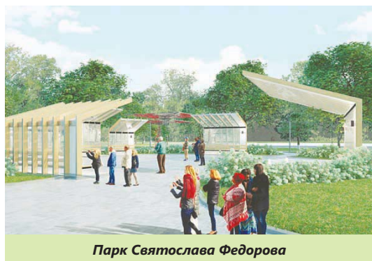
Парк Святослава Федорова