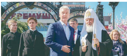
Мэр Москвы С.Собянин и Патриарх Кирилл на фестивале «Пасхальный дар»

– Миллионы людей посещают это замечательное мероприятие. В этом году благотворительность стала лейтмотивом этого фести-