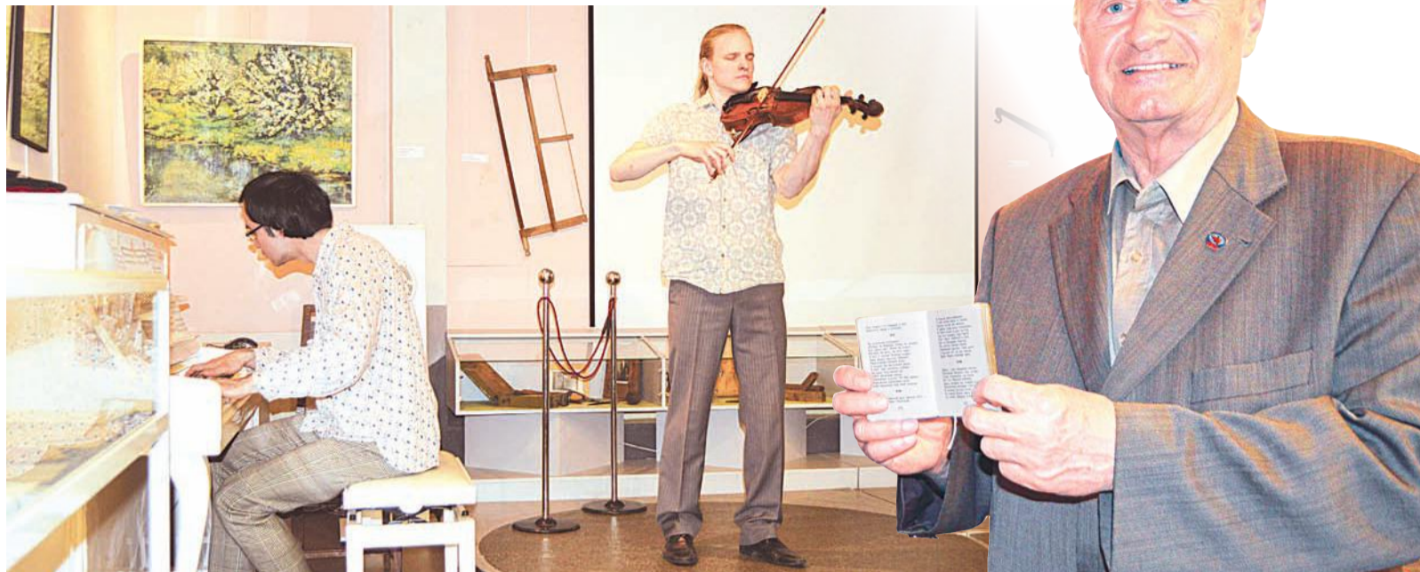
Выпускники школы им. Мусоргского исполнили сонату «Лунный свет».