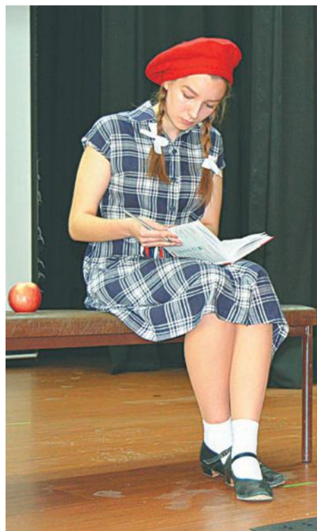
Зрители горячо встретили спектакль.