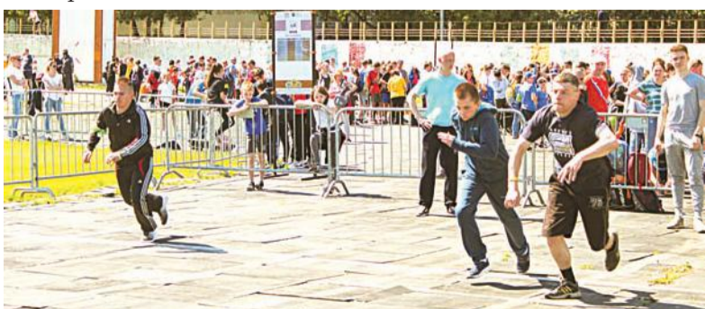
Бег – главная дисциплина ГТО.