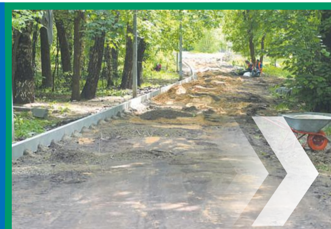
Идут работы по благоустройству