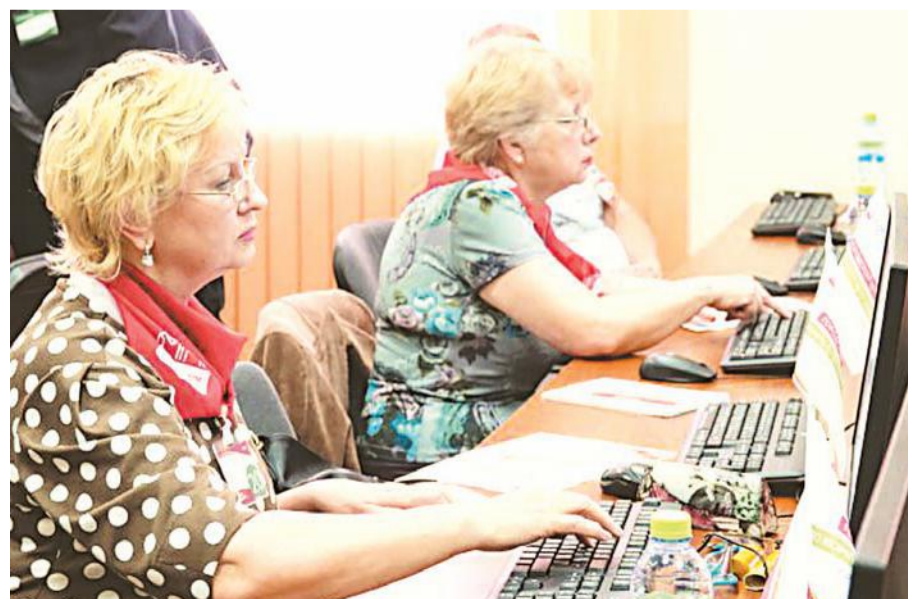
В турнире участвовали люди разных профессий.

■ Зеленоградцы заняли первые места в городском чемпионате по компьютерному многоборью среди участников проекта «Московское долголетие».