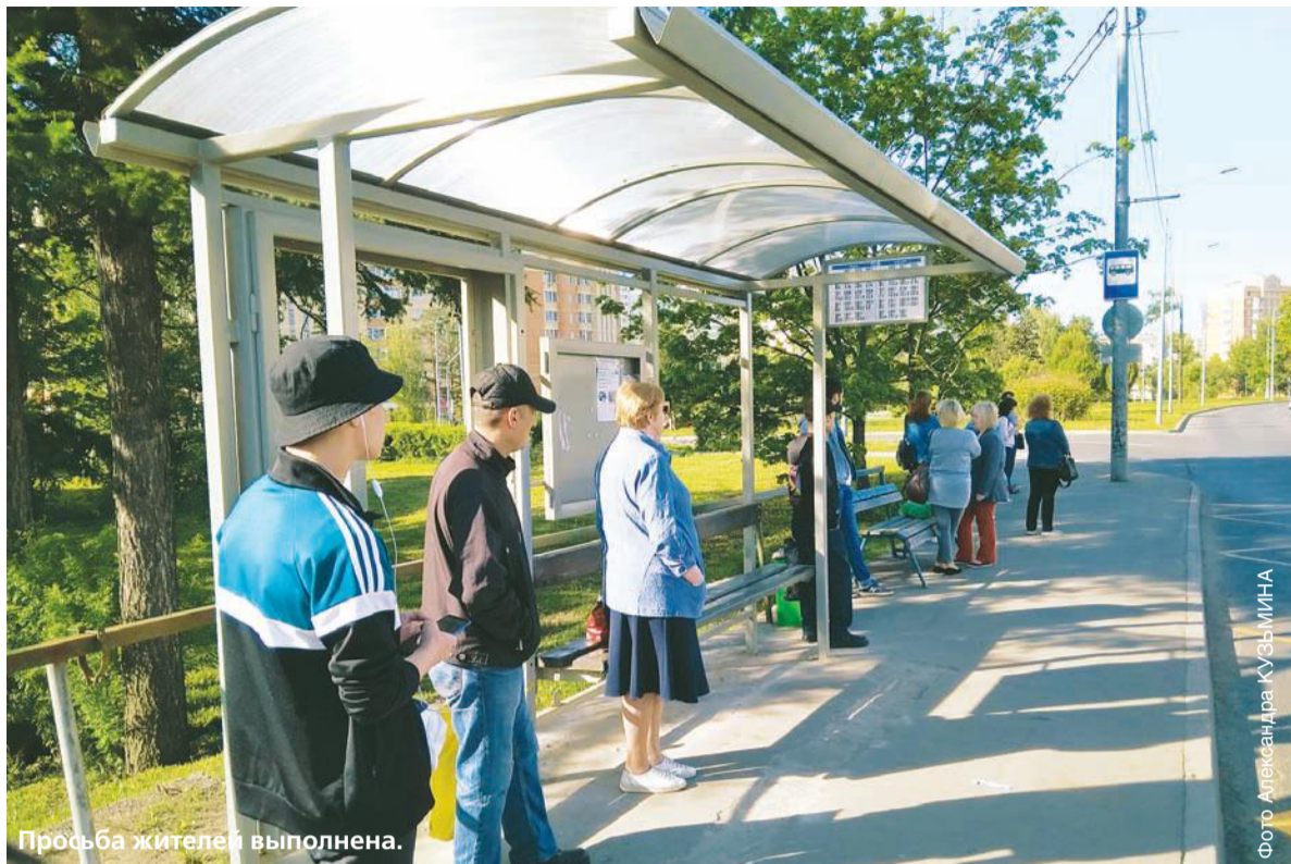
Просьба жителей выполнена.