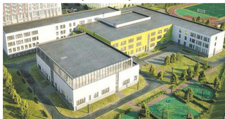
В новом образовательном учреждении появятся IT-лаборатория и мастерские по металлу и дереву.