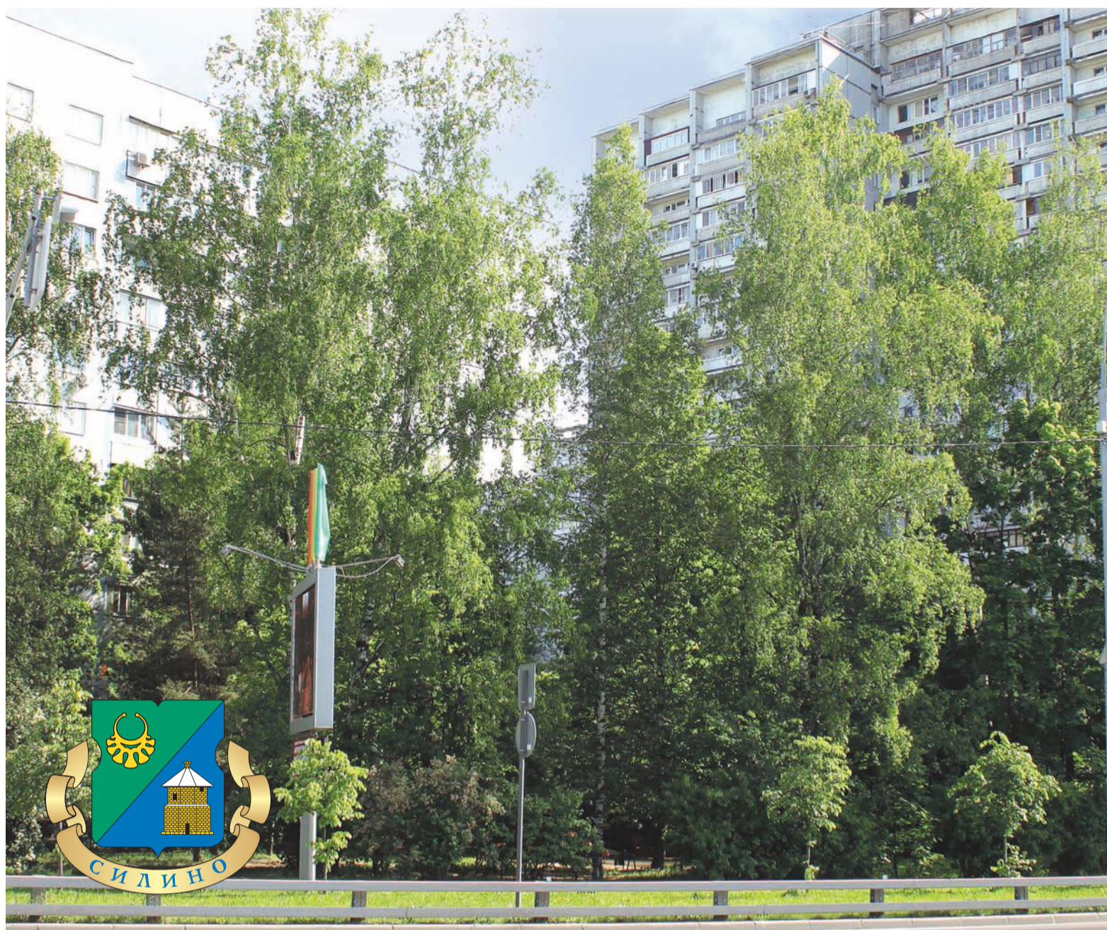
Корпус 1007, за которым располагается реконструируемый парк.

– Двор корпусов 1005, 1006, 1007 – один из самых востребованных в районе. Это не только красивая зона отдыха для жителей всех соседних домов, но и популярный пешеходный маршрут, которым пользуются многие люди, спешащие по своим делам. Благодаря программе «Мой район» парк благоустраивается не по кусочкам, а целиком, комплексно, с учетом современных концепций. Конечно, сейчас жители испытывают временные неудобства, но в конечном итоге, я уверен, будут довольны. Тем более что проект благоустройства парка разрабатывался с их участием.