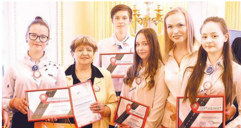
Депутат Госдумы Ирина Белых с выпускниками из Зеленограда.

В Екатерининском зале историко-архитектурного музея-заповедника Царицыно состоялась торжественная церемония вручения сертификатов выпускникам проекта «Московский экскурсовод».