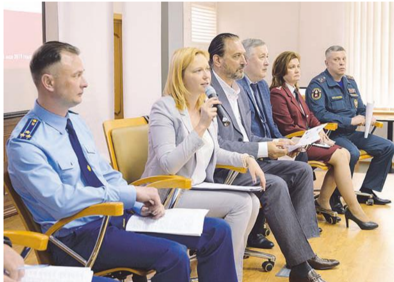
Каждому коммерсанту был дан конкретный ответ.

Также в мероприятии участвовали представители исполнительного надзора, прокуратуры столицы, Федеральной налоговой