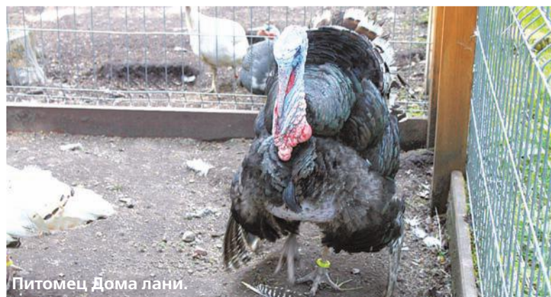
Питомец Дома лани.