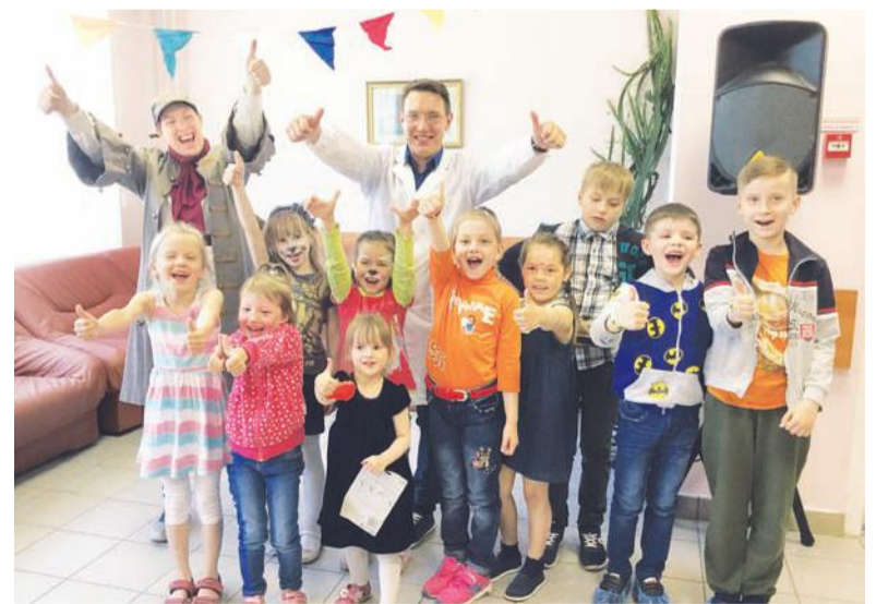
Детский праздник начнется в 11.00.

Детский праздник «Солнышко в ладошках» начнется в 11.00 на первом этаже гинекологического корпуса. Ребята вместе с пиратами отправятся спасать украденные сокровища. Их ждут веселые