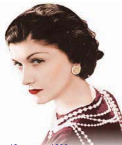
19 августа 1883 г. родилась Габриель (Коко) Шанель – всемирно известная законодательница моды