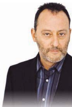
30 июля 1948 г. родился Жан Рено – французский актер испанского происхождения

Вы на пути к позитивным переменам, и они не заставят себя ждать. Руководствуйтесь пословицей «Терпение и труд все перетрут» – и все сложится отлично!