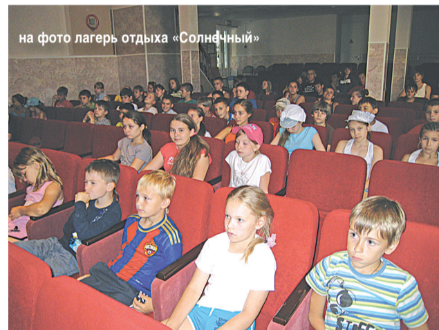
на фото лагерь отдыха «Солнечный»

тому сотрудники ОГИБДД ОМВД по Солнечногорскому муниципальному району в летний период традиционно проводят единые дни профилактики в пришкольных и загородных лагерях, расположенных на территории нашего района. Благодаря этой работе закладываются основы формирования культуры общения, толерантности. Дети обучаются ПДД,