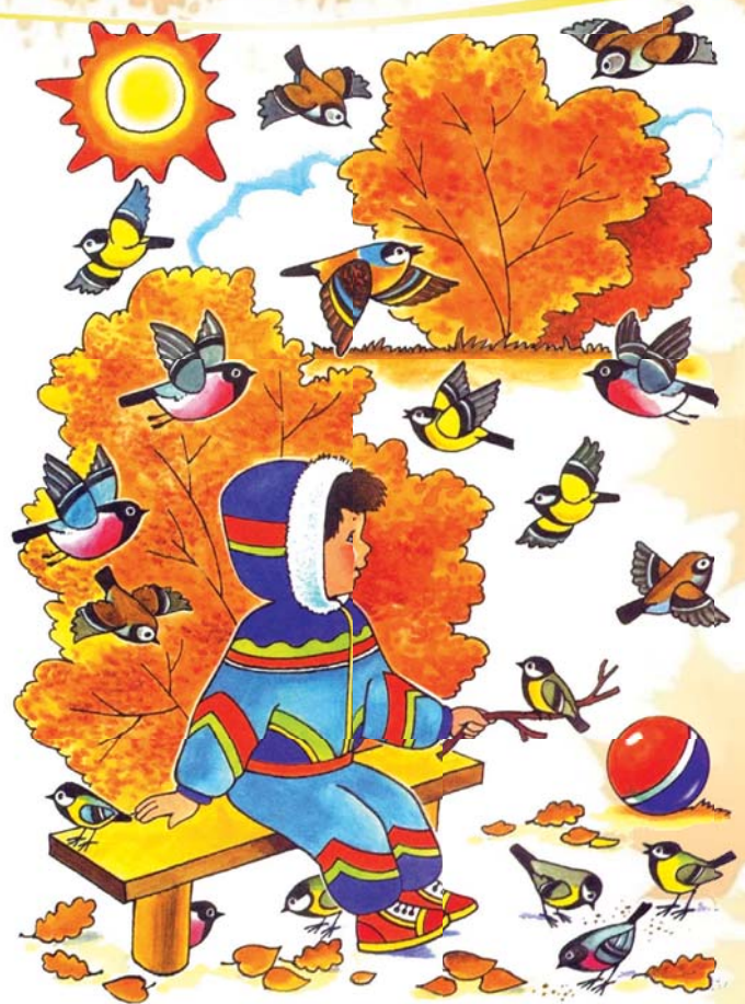
Найди всех птичек