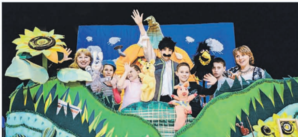
25 марта 2014 года. 17.07 Сцена из спектакля «Поросенок MONSTER MANIA» в исполнении Театра актера, маски и кукол «Поветруля» из Дубны. Спектакль показывают в доме культуры «Рублево»

ПРОГРАММА ДОМОВ КУЛЬТУРЫ НА КАНИКУЛЫ vm.ru