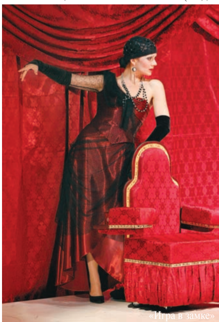
«Игра в замке»