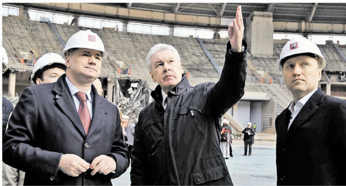
25 марта 2014 года. 11.08 Мэр Москвы Сергей Собянин (в центре) вместе с главой столичного стройкомплекса Маратом Хуснуллиным (слева) и главой Департамента строительства Андреем Бочкаревым осматривают Большую спортивную арену «Лужники»