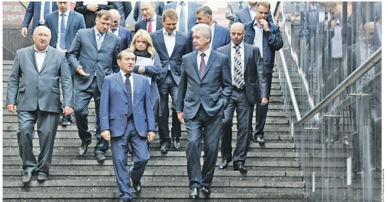
11 июля 2014 года. 12.19 Мэр Москвы Сергей Собянин с министрами московского правительства посетили подземный переход «Московский» и обсудили реорганизацию торговли и благоустройство «улиц» под землей