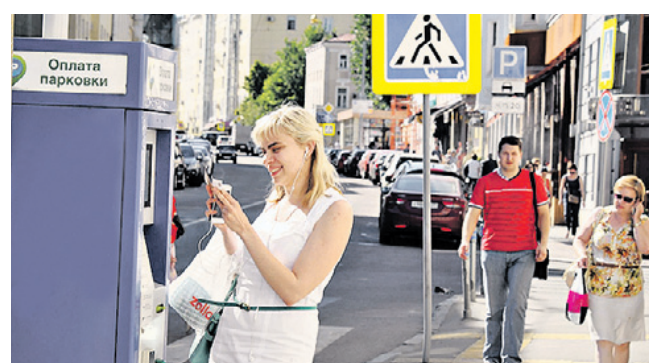
Парковку в новой зоне можно будет оплачивать так же, как и в центре — через sms, терминалы или паркоматы

Оплачивать ее можно будет привычными способами: через sms или мобильное приложение «Парковки Москвы», через терминалы, паркоматы, банковскими картами, наличными. Планируется, что в новой зоне будут действовать коммерческие парковочные абонементы по цене 8 тысяч рублей в месяц и 80 тысяч в год. Жители пяти районов смогут бесплатно оставлять автомобили с 8 вечера до 8 утра, для этого надо оформить резидентское парковочное разрешение в многофунк-