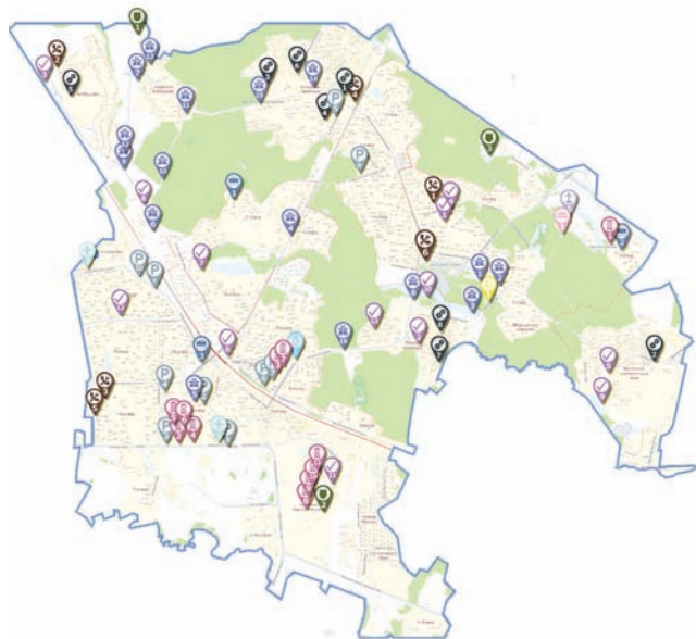
Построенные объекты 2011-2013 гг.