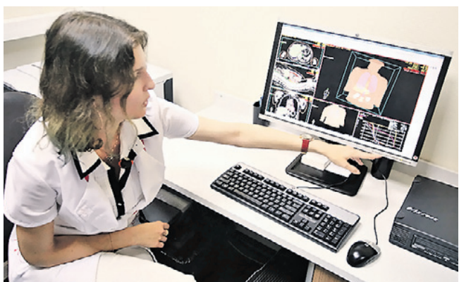
Для улучшения качества лечения москвичей власти предлагают привлекать не только технологии, но и профессорский состав

На базе больницы номер 57 работают три университетские кафедры, но уровень их взаимодействия с больницей можно было бы поднять. — Я обязательно пообщаюсь с ректорами наших вузов, конечно, надо запустить проект более тесной взаимосвязи московских вузов и клиник, — сказал градоначальник.