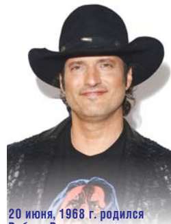
20 июня, 1968 г. родился Роберт Родригес — режиссер, сценарист, продюсер