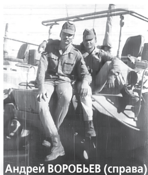
Андрей ВОРОБЬЕВ (справа)

■ 15 февраля в городском округе Солнечногорск отметили важную историческую дату - День памяти о россиянах, исполнявших служебный долг за пределами Отечества. Ровно 35 лет назад, 15 февраля 1989 года, завершилось выполнение задач 40-й армией в Афганистане и последние советские войска покинули республику.