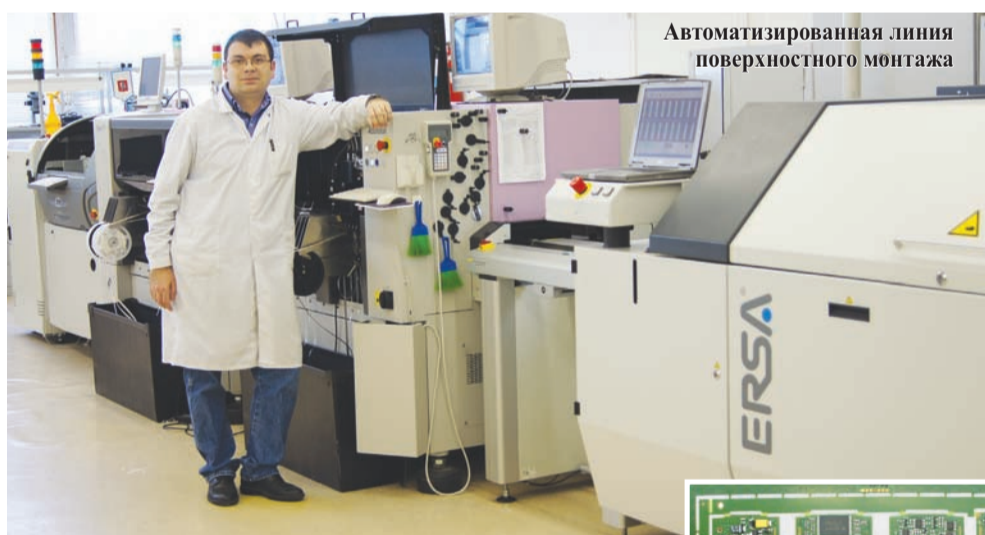
Автоматизированная линия поверхностного монтажа

Не секрет, что отечественная компонентная база зачастую не выдерживает конкуренции с зарубежными аналогами. При выполнении государственного заказа нам необходимо по условиям госзакупок принимать меры к снижению стоимости изготов-