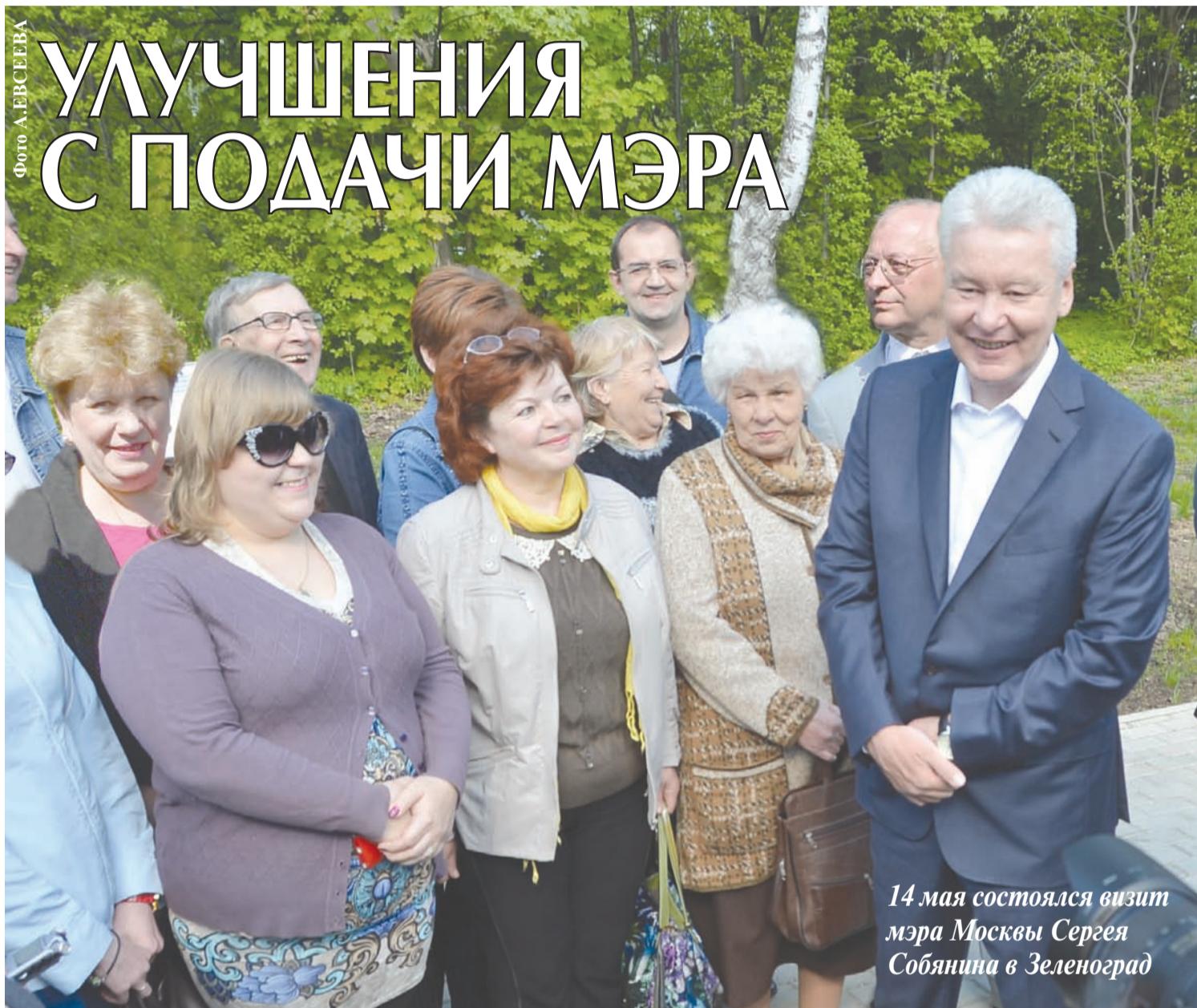
14 мая состоялся визит мэра Москвы Сергея Собянина в Зеленоград