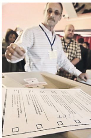
К пробным выборам в Мосгордуму Оргкомитет готовит бюллетени

Более 30 тысяч москвичей зарегистрировались выборщиками, чтобы проголосовать 8 июня на предварительных выборах в Мосгордуму. Наиболее активно избиратели регистрируются на юге и юго-востоке Москвы: в районах Лефортово, Текстильщики, Печатники, Зябликово и Братеево. Регистрация выборщиков, напомним, продлится до 3 июня.