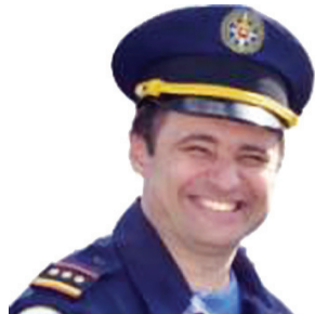
Начало на стр. 1

Осталась жива... Отработали быстро, хорошо.