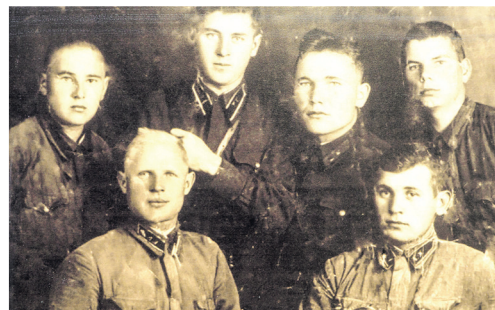
Красноармейцы, освобождавшие город

«Механическом» — одновременно с демонтажем оборудования продолжался выпуск продукции для фронта. Эшелоны с заводским оборудованием и людьми эвакуировались на восток.