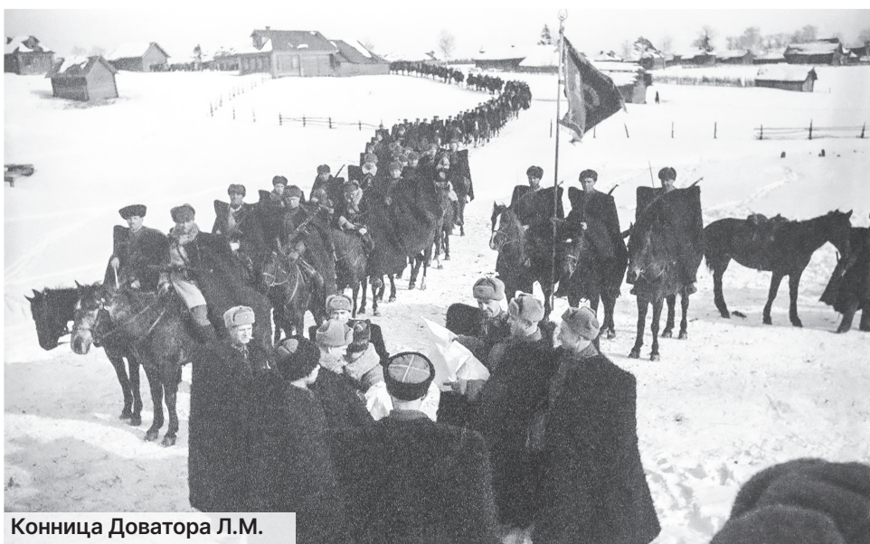
Конница Доватора Л.М.

дом за домом, улицу за улицей, квартал за кварталом. Приблизившись к Никольской церкви, бойцы услышали крики о помощи — в церкви захватчики закрыли стариков, женщин, детей. А с колокольни по насту-