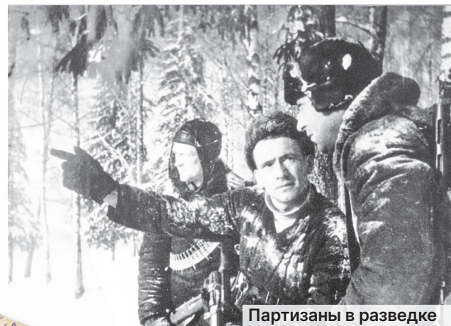
Партизаны в разведке

В пламени Вечного огня, в величественных мемориалах и скромных обелисках, в мемориальных досках и памятных плитах, в сердцах солнечногорцев хранится вечная, благодарная и неугасимая память о тех, кто в суровые военные годы невероятным напряжени-