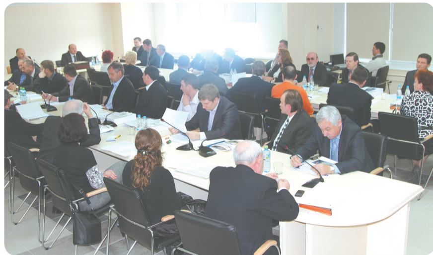
Юбилейное заседание НП «Промышленники и предприниматели Солнечногорского района»