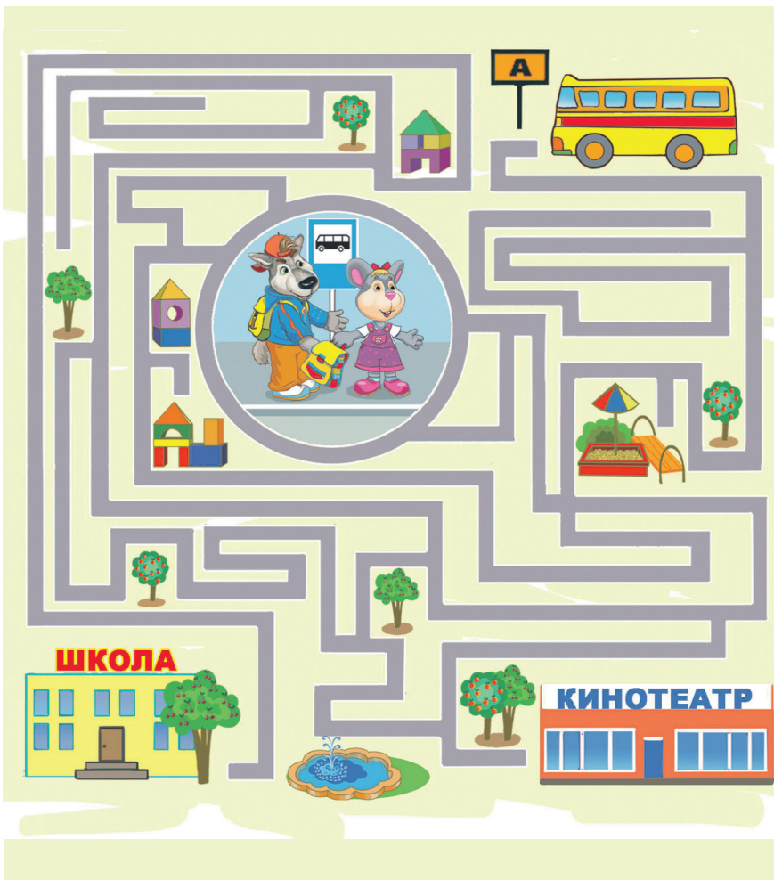
Автобус движется строго по серым линиям

Шуня и Зубок опаздывают в школу. Автобус должен забрать их и отвезти именно в школу, а не в кино! Помогите Шуне и Зубку найти дорогу!