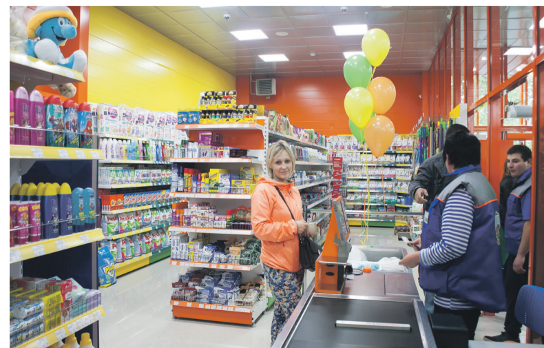
Довольные первые покупатели