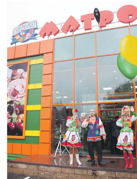
Праздничное выступление на открытии

Руководители сети супермаркетов «Матроскин» поже-