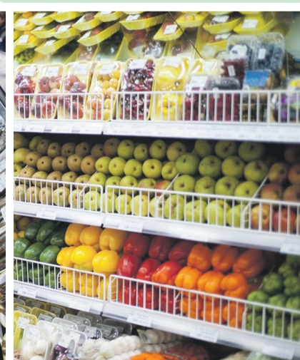
Примеры широкого ассортимента продуктов на витринах