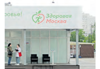
Павильон на пл. Юности

Сергей Собянин уточнил, что обследование могут пройти все желающие с 18 лет, прикрепленные к городским поликлиникам. С собой нужно взять московский полис ОМС и документ, удостоверяющий личность. Павильоны «Здоровая Москва» работают каждый день с 8.00 до 20.00 без перерывов и выходных.