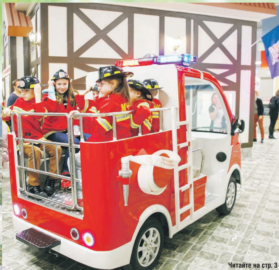
Читайте на стр. 3

ДЕТСКИЕ ТОРТЫ на заказ к любым торжествам ФИРМЕННЫЕ МАГАЗИНЫ: - мкрн. Рекинцо-2, ул. Молодежная, д. 1 - площадь Советская - М.О. Солнечногорский р-н, пос. Смирновка, ТЦ - ул. Дзержинского, вблизи д.18 8-903-234-15-89, 8-496-263-46-70, 8-496-263-47-33