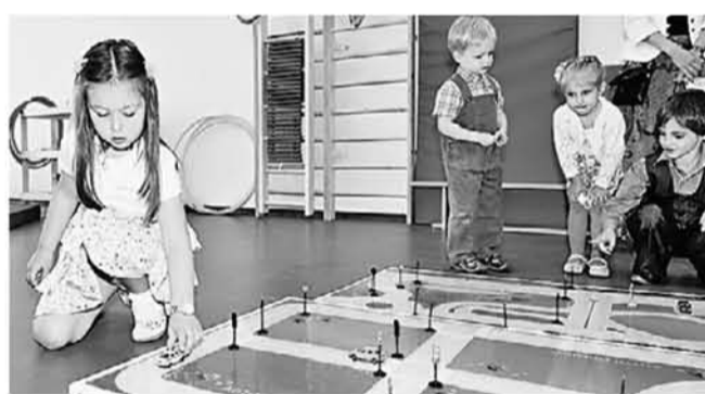
Скоро дети будут играть не дома, а в садике

Напомним, при электронной записи в детский сад родители могут указать три желаемых учреждения. Одно — приоритетное. Система распределения работает так, что, если в выбранном детса-