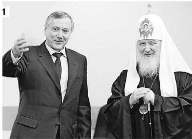
Суббота, 1 марта 11.33 Глава метрополитена Иван Беседин (слева) провел экскурсию для Патриарха Московского и всея Руси Кирилла (1) Во время встречи с коллективом метро (2)

Место встречи — актов зал. В него еле поместились 300 человек. В зал вошли Патриарх Московский и всея Руси Кирилл и глава Московского метрополитена Иван Беседин.