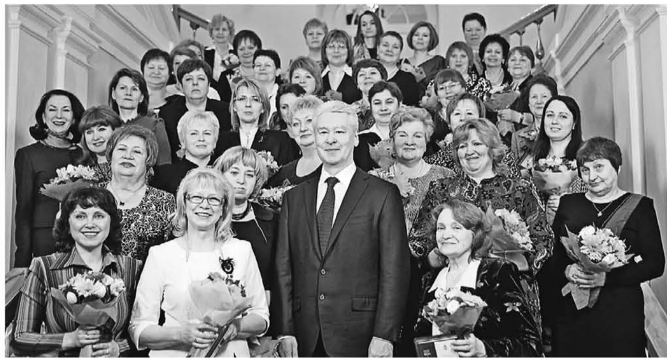
3 марта 14.55 Поздравляя москвичек, мэр отметил: многое, что делается в столице, создается благодаря ее жительницам