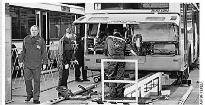
Новые автобусы и ремонт-то еще не выдвляли

В этом году распределение детей в детские сады происходило автоматически, но пожелания родителей, которые они указали в электронном заявлении, учитывались. Сообщение о том, в какой детский сад распределен ваш ребенок, придет родителям по указанной ими электронной почте.