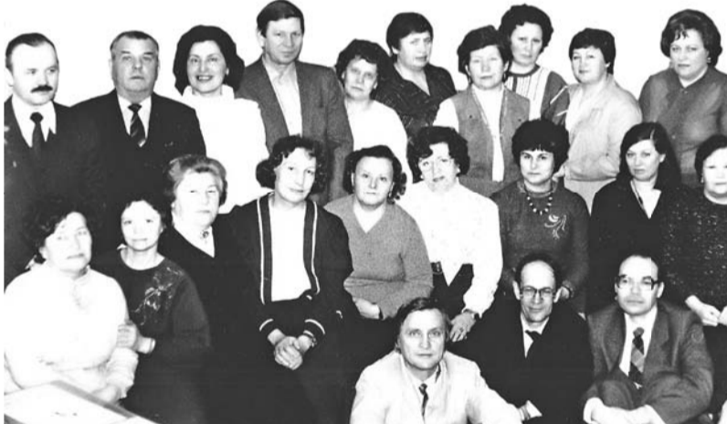
Они были первыми.