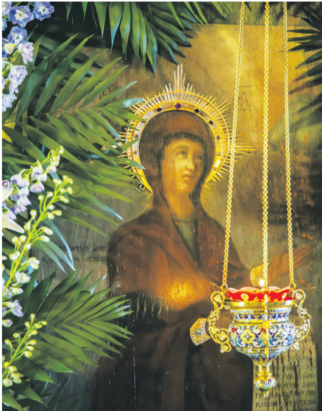
Образ Пресвятой Богородицы «Боголюбская»

По многолетней традиции в Спасском храме г. Солнечногорска состоялось праздничное богослужение в честь памяти чудотворного образа Царицы Небесной – Боголюбской иконы Божией Матери.