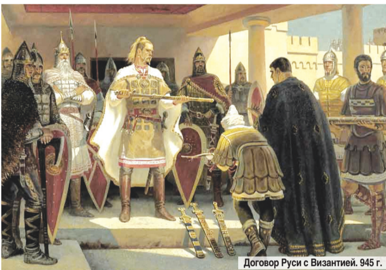
Договор Руси с Византией. 945 г.

Но печенежские орды оставались все же потенциально опасным врагом, угрожали набегами русским городам. Поэтому Владимир построил оборонительную линию южнее Киева - ряд крепостей по рекам Суле, Десне, Стугне. В народных былинах эти крепости названы богатырскими заставами.