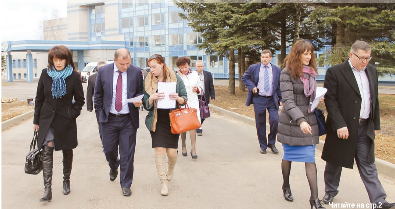
Читайте на стр.2