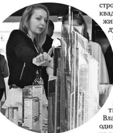
Проекты на MIPIM не могли не удивлять посетителей

правительства Москвы во главе с заместителем мэра столицы по вопросам градостроительной политики и строительства Маратом Хуснуллиным. Надо сказать, что Москва участвует в MIPIM уже 20-й раз, и второй год подряд на ней, среди прочих проектов, представлены проекты Новой Москвы. Как неоднократно подчеркивал в ходе выставки Хуснуллин, на новых территориях столицы начался настоящий инвестиционный бум. Если до присоединения здесь