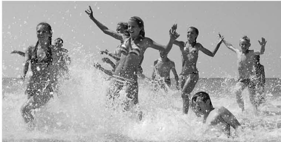
Жаркие июльские дни во Всероссийском детском центре «Орленок» в Краснодарском крае ребята запоминают на всю жизнь

В столице официально стартовала летняя оздоровительная кампания. 17 марта на городском портале государственных услуг были размещены первые льготные путевки. Родителям и детям предложили отдых в коттеджном поселке «Пирин» в Болгарии. Остальные путевки в учреждения отдыха и оздоровления, где летом будут отдыхать московские ребята, будут размещены на портале 25 апреля, опять же ровно в полдень. Для того чтобы получить заветную путевку, необходима в первую очередь регистрация на портале (pgu.mos.ru). После подачи заявления на отдых в течение пяти рабочих дней через личный кабинет родители получают уведомление с просьбой прийти в управу. Это нужно будет сделать только один раз — забрать сертификат на отдых для ребенка. Кстати, в этом году географию детского отдыха расширили. Правительство Москвы организует отдых для детей-льготников