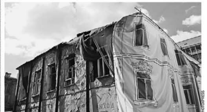
Если в доме никто не живет, это не значит, что про него забыли

— Проблема, связанная с пустующими домами, состоит в том, что туда порой приходят алкоголики, наркоманы или нелегальные мигранты. Они зачастую устраивают пожары, — пояснил Майоров. — Но благодаря активности жителей районов и проводимой работе совместно с правоохранительными органами и территориальными подразделениями органов исполнительной власти Москвы проблему удастся решить.