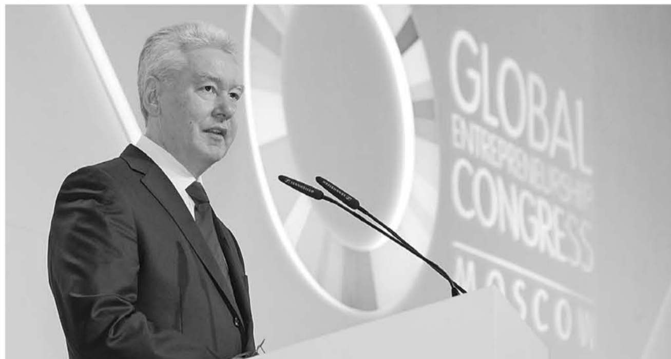
17 марта 10.20 Мэр Москвы Сергей Собянин в приветственной речи участникам Всемирного конгресса предпринимателей подчеркнул: «Москва создала активную и быстрорастущую среду для развития бизнеса и инвестиций»