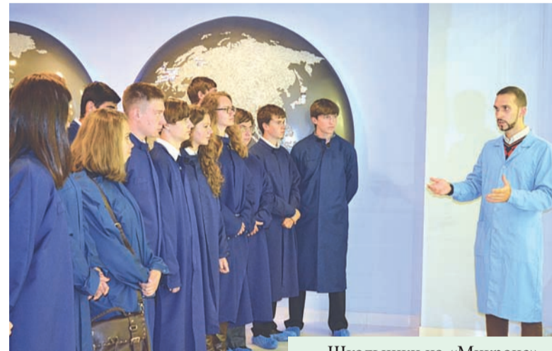
Школьники на «Микроно»

Функционал кадровой службы был расширен необходимостью участвовать в имиджевых для компании мероприятиях: ярмарках,